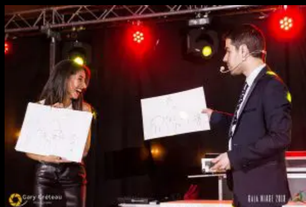
Un exemple d'une expérience de mentalisme

D'une durée d'une heure environ, il est calibré pour être ni trop court, ni trop long.